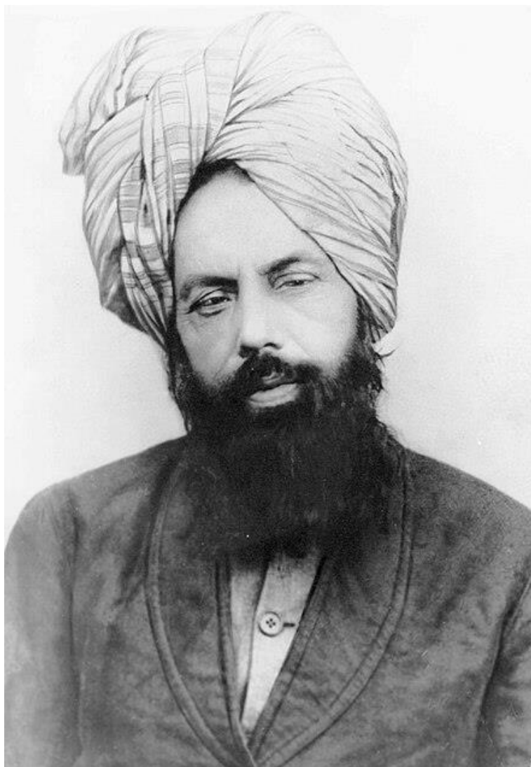
Ҳазрати Мирзо Ғулом Аҳмад алайҳиссалом Имом Маҳдӣ ва Масеҳи мавъуд